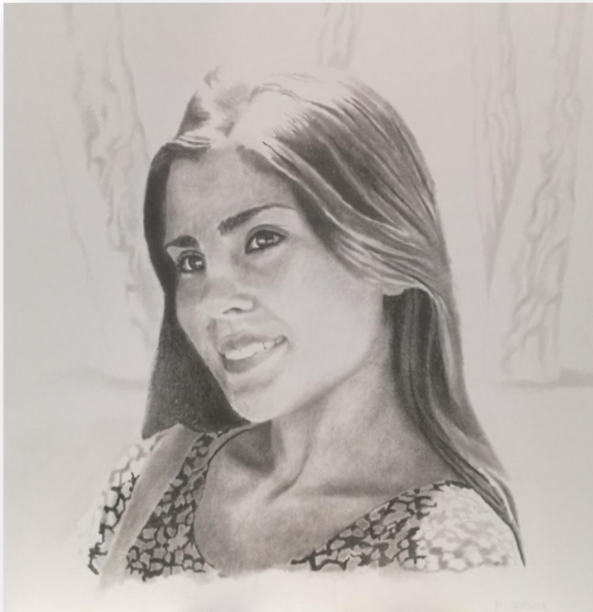
Pedro Quesada "Helena" Dibujo 70 x 70