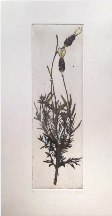
Laura Ríos "Lavanda" Grabado en hueco iluminado 41 x 11,5