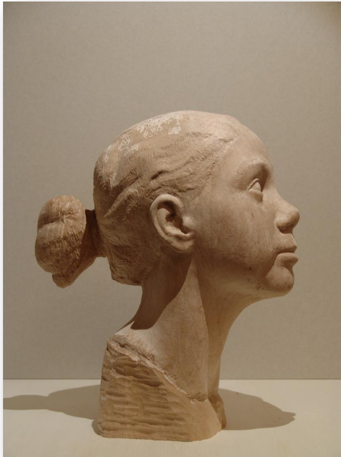
Pedro Quesada "Mi hermana" Talla madera 40 x 30 x 20