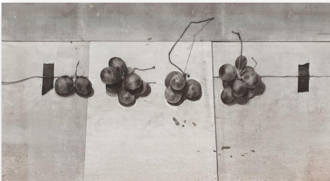
Laura Ríos "Uvas y cordel" Grafito sobre cartón 28,5 x 48,5