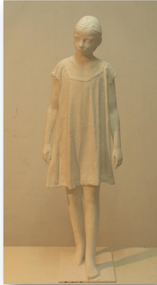
Pedro Quesada "Lola" Bronce 30 x 30 x90