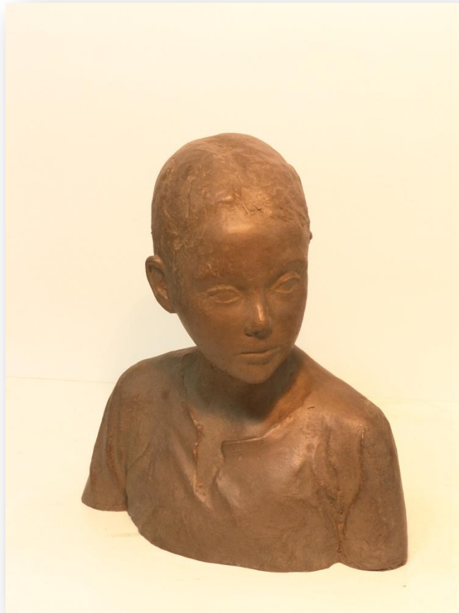
Pedro Quesada "Figura mirando" Bronze 30 x 25 x 10