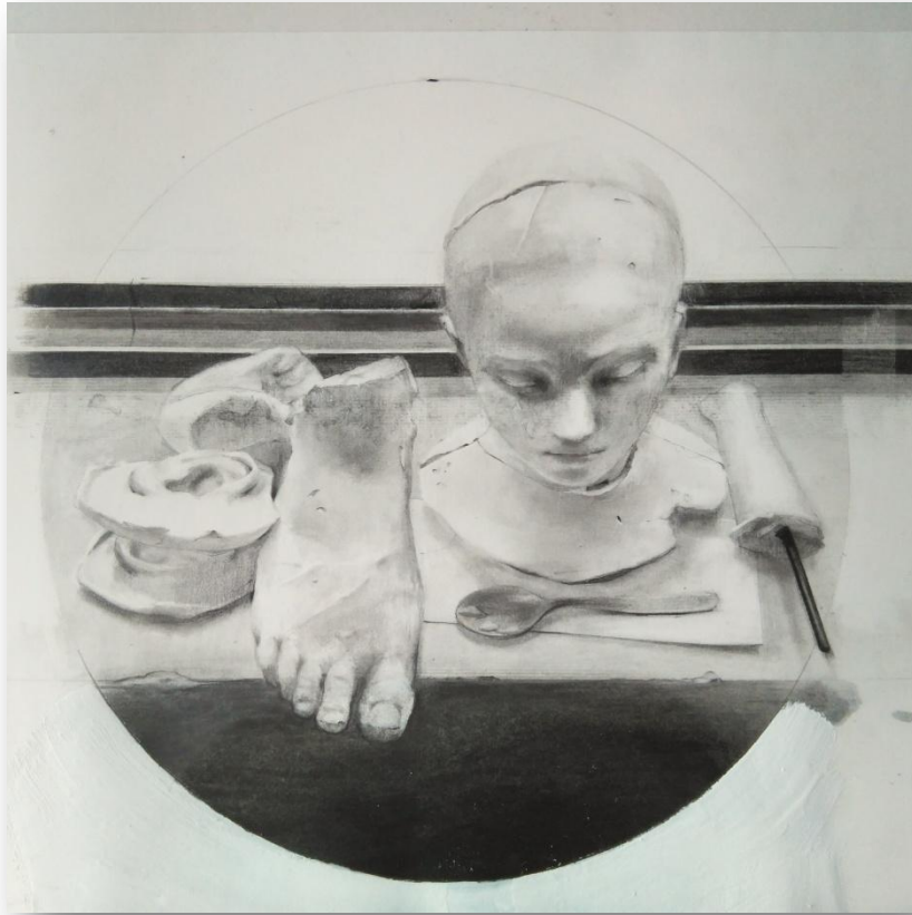
Laura Ríos "Bodegón , orejas y cuchara" Técnica mixta 37 x 48