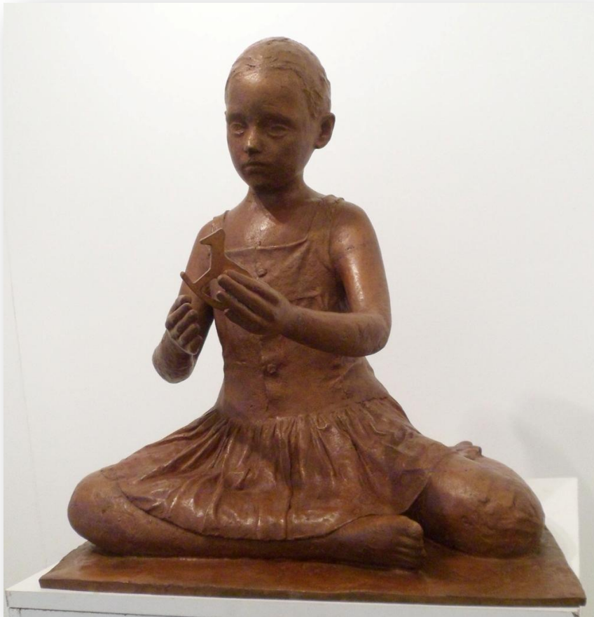
Pedro Quesada "Figura jugando" Bronce 60 x 50 x 50