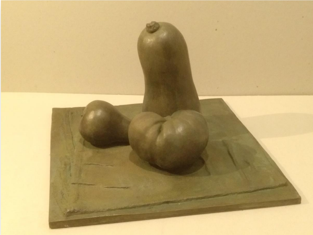
Pedro Quesada "Bodegón II" Bronze 35 x 30 x 20