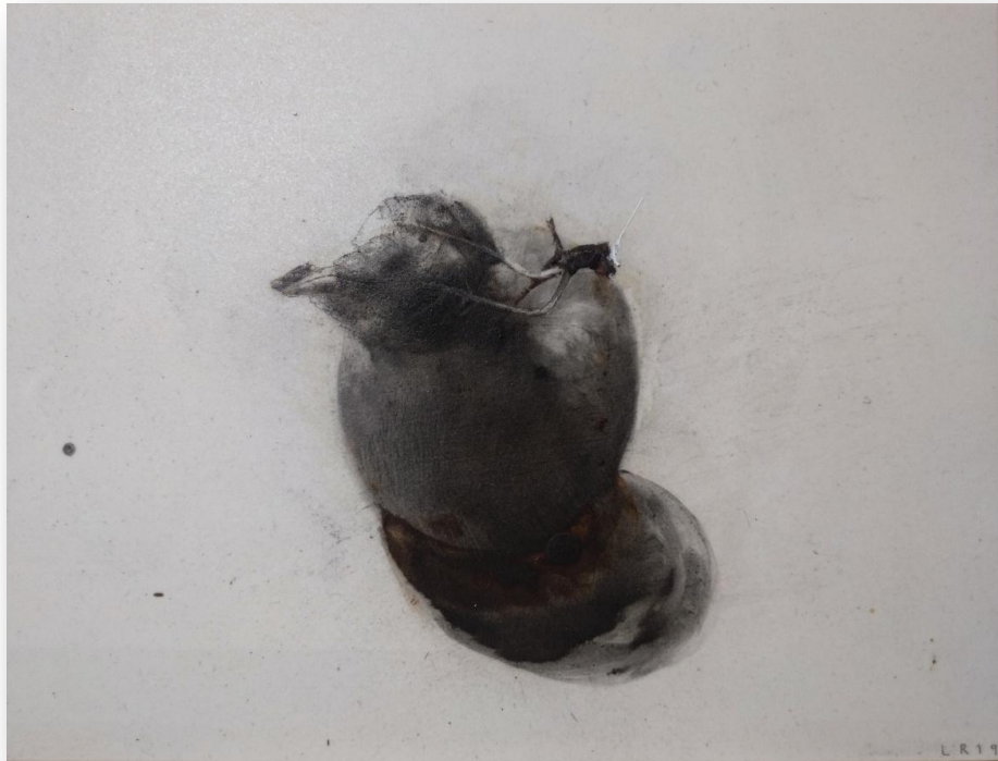
Laura Ríos "Manzana II" Mixta sobre porcelana 19,5 x 24