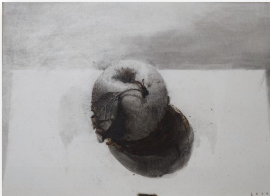
Laura Ríos "Manzana I" Mixta sobre porcelana 19,5 x 24