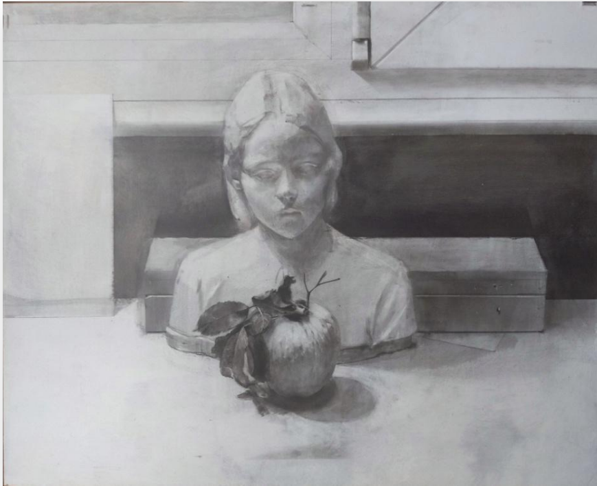
Laura Ríos "Busto y manzana" Grafito sobre cartón 39,5 x 48,5